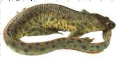
Figura 50: Gallipato.

1.- Con cola. URODELOS. Una fila de verrugas anaranjadas en cada lado del cuerpo. Sólo 1 especie en la Comunidad Valenciana (f fig. 50)..... Gallipato ( Pleurodeles waltl )