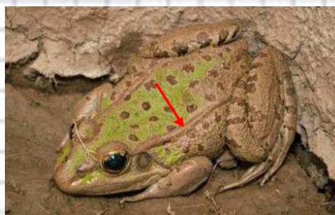
Figura 64: Rana común. La flecha indica los pliegues dorsolaterales.

- Pupila en forma de corazón e iris dorado. Tímpano no visible. Color pardo, con grandes manchas más oscuras (fig. 65 y 66)..... Sapillo pintojo ( Discoglossus jeanneae )