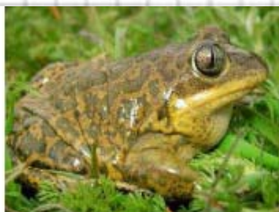
Figura 52: Sapo de espuelas.

- Sin espuela en las patas posteriores..... 3