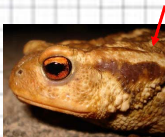
Figura 53: Cabeza de un sapo del género Bufo , con la glándula paratoidea tras los ojos.

- Sin grandes glándulas detrás de los ojos ..... 5