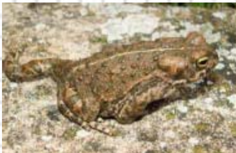
Figura 54: Característica posición del sapo corredor. Sus cortas patas posteriores le impiden saltar.

4.- Iris amarillento. Color del cuerpo verdoso o pardo. Patas posteriores cortas (fig. 54). A veces con una línea vertebral más clara (fig. 55)..... Sapo corredor ( Epidalea calamita )