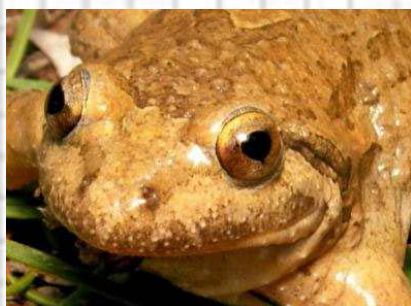
Figura 65: Sapillo pintojo. La pupila tiene forma de Corazón o de gota invertida.

- Pupila en forma de corazón e iris dorado. Tímpano no visible. Color pardo, con grandes manchas más oscuras (fig. 65 y 66)..... Sapillo pintojo ( Discoglossus jeanneae )