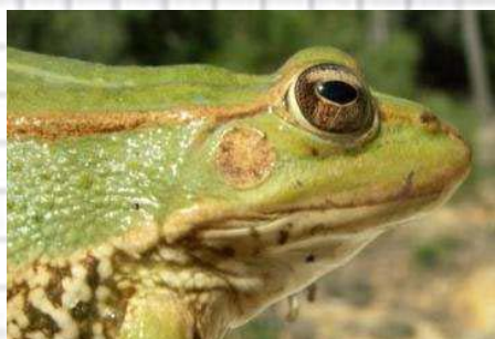
Figura 63: Cabeza de rana común. Se observa el tímpano y la pupila ovalada.

7.- Pupila ovalada e iris dorado. Tímpano visible. Pliegues marcados en los costados. Color variable, desde pardo hasta verdoso (fig. 63 y 64)..... Rana común ( Pelophylax perezi )