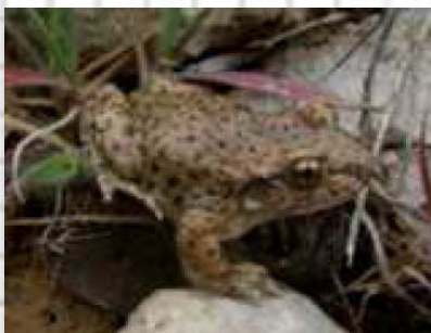
Figura 61: Sapo partero con unos marcados puntos anaranjados.

6.- Cuerpo rechoncho y patas cortas. Color pardo o grisáceo con puntos anaranjados. Tímpano visible (fig. 61 y 62)..... Sapo partero común ( Alytes obstetricans )