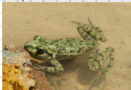
Figura 59: Sapillo moteado. Se aprecian las patas posteriores alargadas y las motas verdosas.

6.- Cuerpo esbelto y patas alargadas. Color pardo o grisáceo con puntos y verrugas verdosas (fig. 59 y 60) Sin tímpano visible ..... Sapillo moteado ( Pelodytes punctatus )