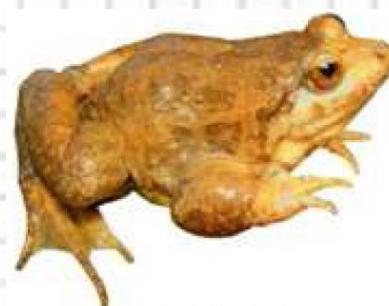
Figura 66: Sapillo pintojo.