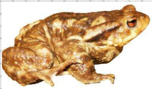
Figura 57: Sapo común ( Bufo bufo ).