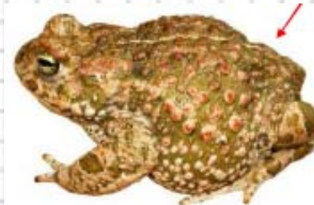
Figura 55: Sapo corredor ( Bufo calamita ). La flecha señala la línea vertebral.

- Iris rojizo. Color del cuerpo pardo rojizo a grisáceo. Las hembras pueden alcanzar los 18 cm. (fig. 57)..... Sapo común ( Bufo bufo )