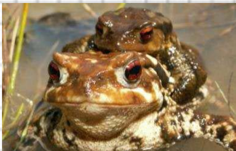
Figura 56: Pareja de sapos comunes. La hembra (abajo) suele ser más grande que el macho.

- Iris rojizo. Color del cuerpo pardo rojizo a grisáceo. Las hembras pueden alcanzar los 18 cm. (fig. 57)..... Sapo común ( Bufo bufo )