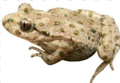
Figura 60: Otro ejemplar de sapillo moteado de color grisáceo.