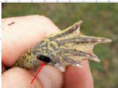
Figura 51: Detalle de la espuela.

2.- Con una espuela o uña de color negro en las patas posteriores (fig. 51). Pupila vertical y color verdoso manchas más oscuras (fig. 52)..... Sapo de espuelas ( Pelobates cultripes ,